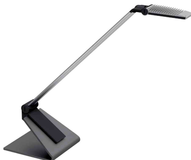
Lampe de bureau design LED MAULsolaris